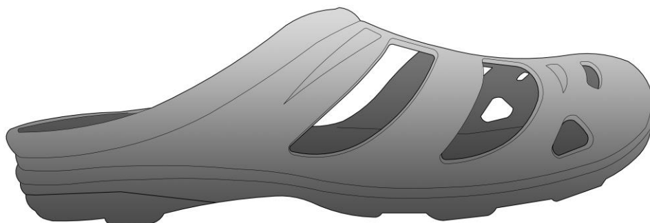
рисунок 2. Зовнішній вигляд виробу Тип 2