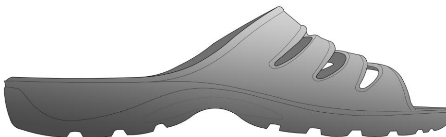
рисунок 1. Зовнішній вигляд виробу Тип 1