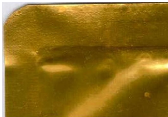
Зовнішній вигляд якісного реторт-паketу