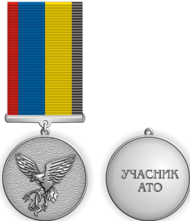
Рисунок Д1.1 – Зовнішній вигляд предмета