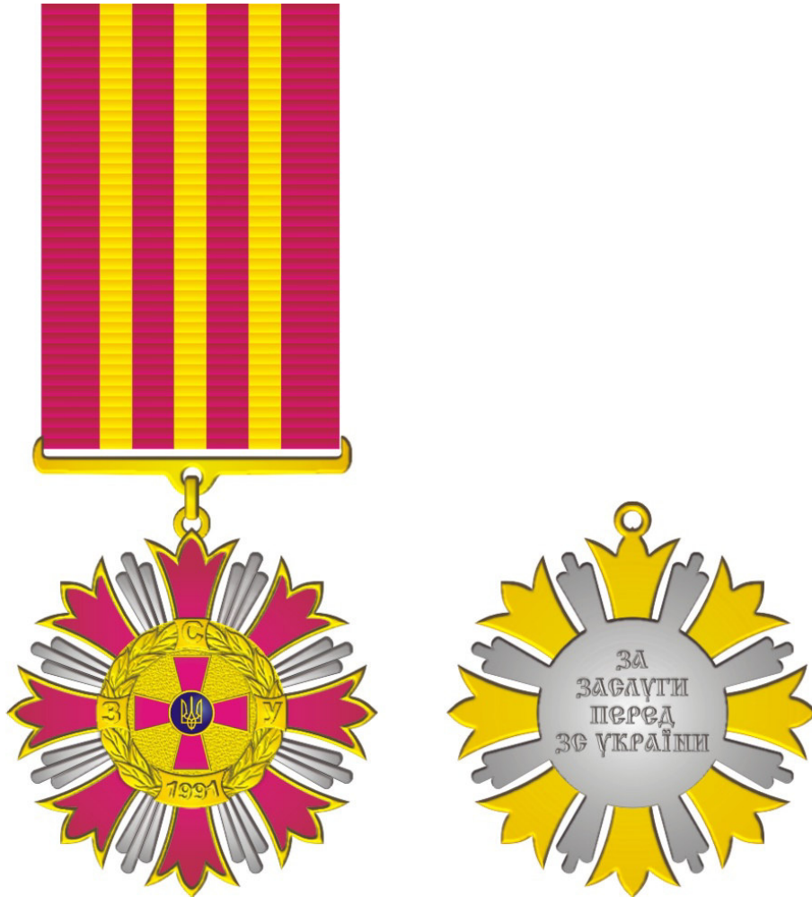
Рисунок Д1.1 – Зовнішній вигляд предмета