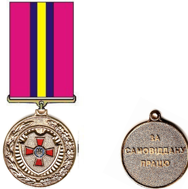
Рисунок Д1.1 – Зовнішній вигляд предмета