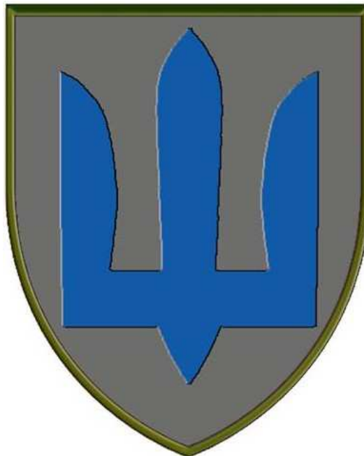
Мал.1. Зовнішній вигляд нарукавного знаку.

1.1.3. Зображення, що нанесене на нарукавний знак, має відповідати опису та малюнку, затвердженому у встановленому порядку. Зовнішній вигляд нарукавного знаку наведено на мал.1.