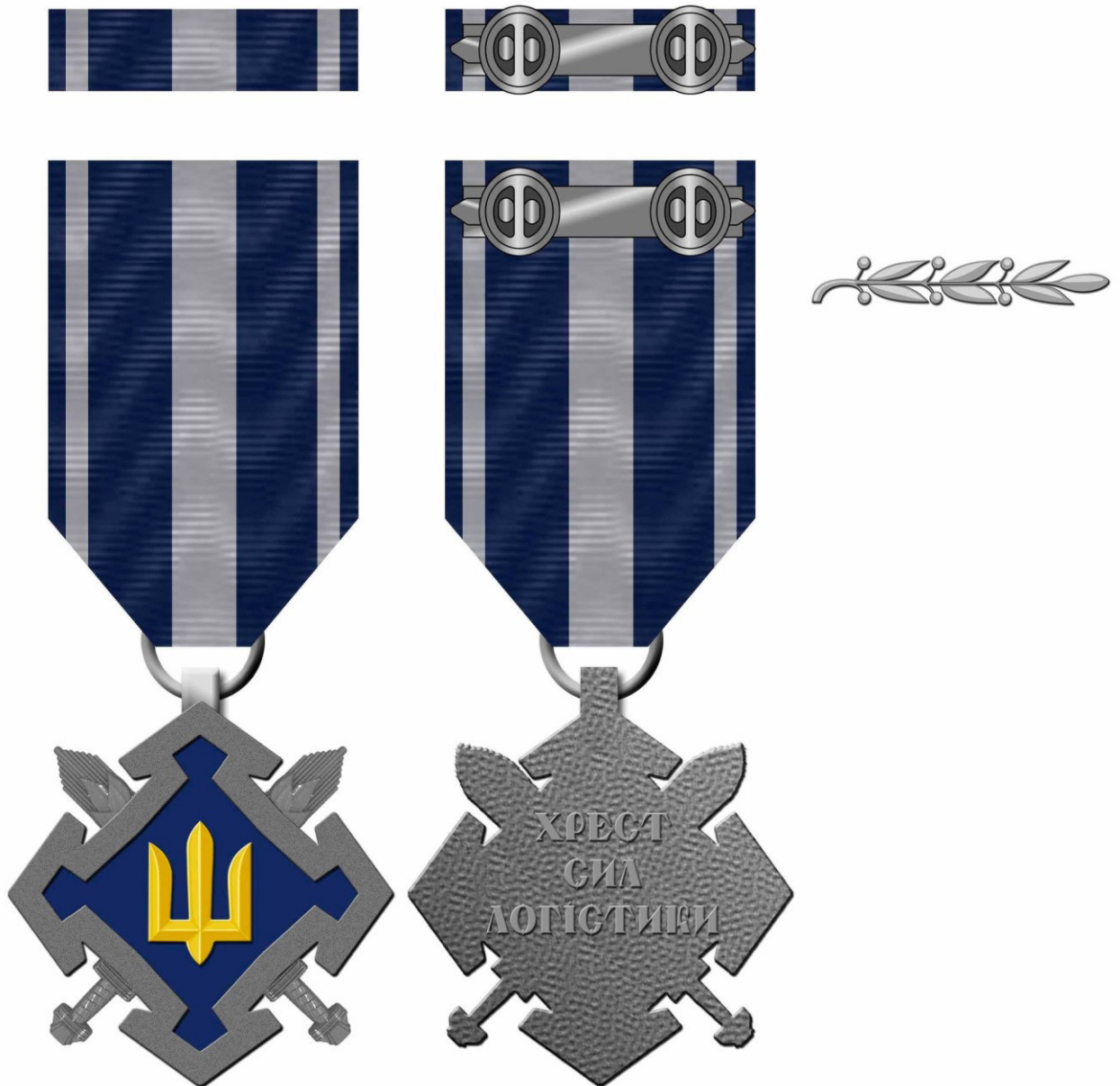
Рисунок Д1.1 – Зовнішній вигляд предмета