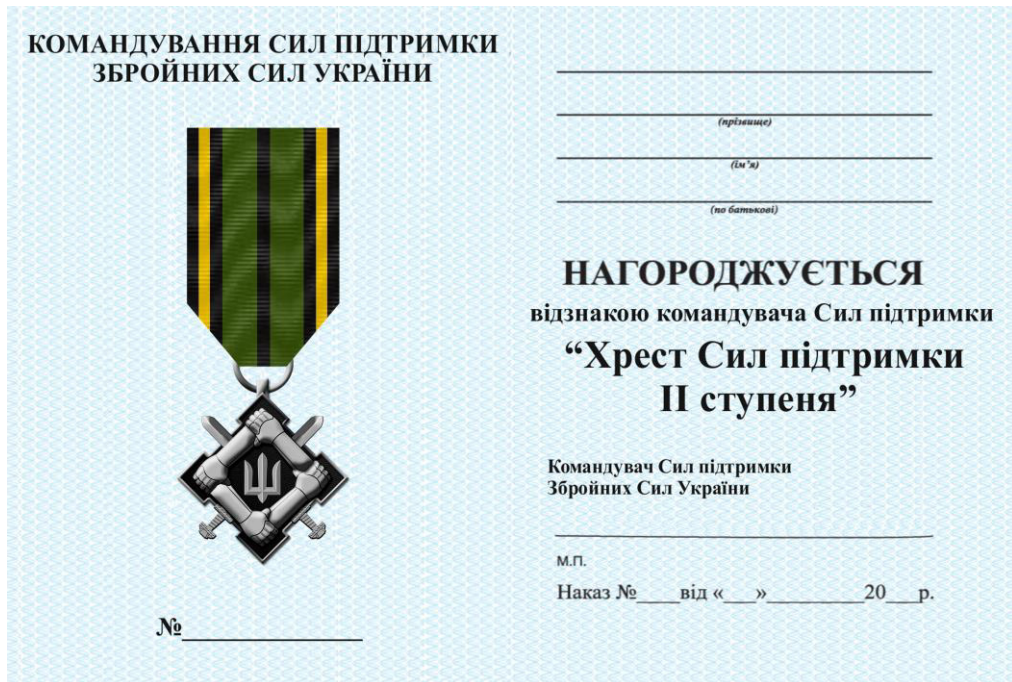
Рисунок Д1.1 – Зовнішній вигляд предмета

Начальник відділу розробки та впровадження військової символіки управління розвитку речового забезпечення Центрального управління розвитку та супроводження матеріального забезпечення Збройних Сил України полковник