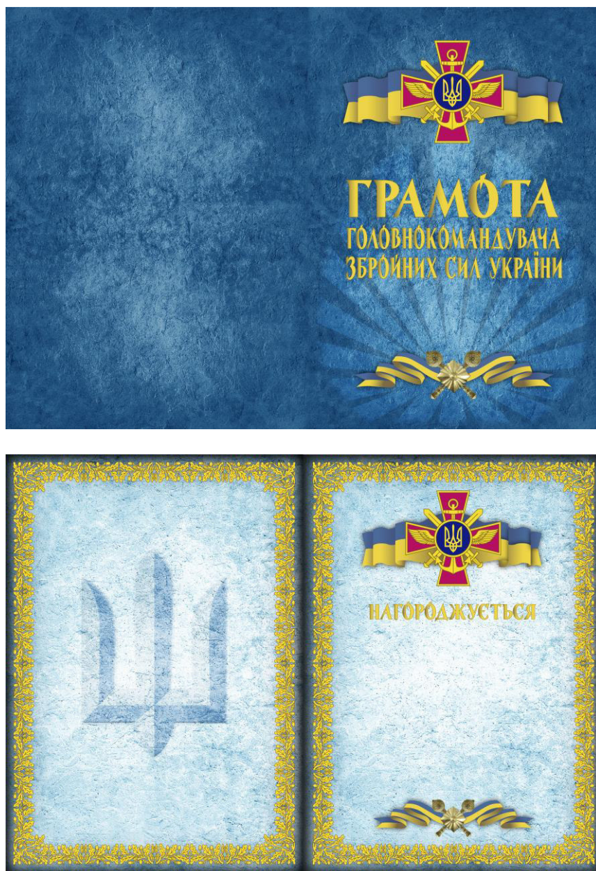
Рисунок Д1.1 – Зовнішній вигляд предмета

Начальник відділу розробки та впровадження військової символіки управління розвитку речового забезпечення Центрального управління розвитку та супроводження матеріального забезпечення Збройних Сил України полковник