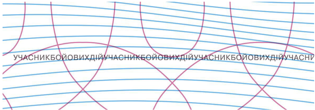
Рисунок Д2.1 – Мікротекст