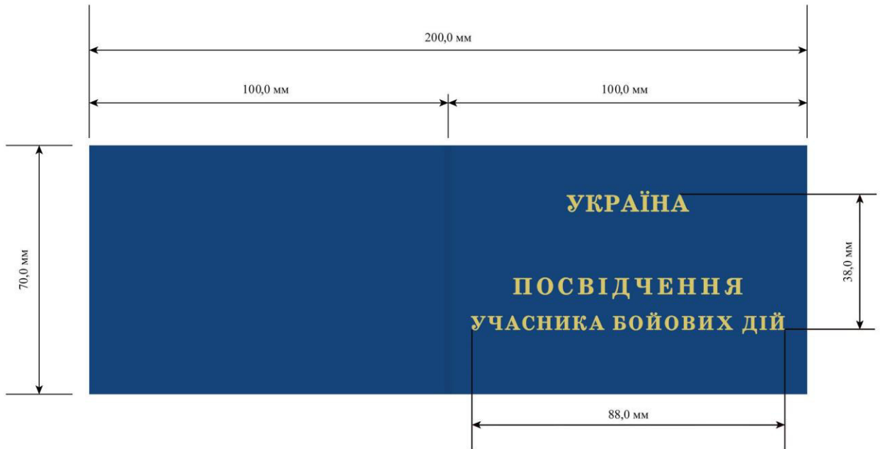
Рисунок Д1.1 – Зовнішній вигляд та лінійні розміри обкладинки предмета