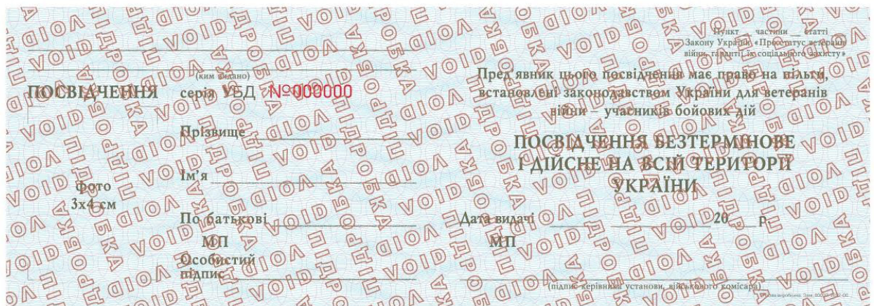
Рисунок Д2.3 – Зовнішній вигляд та лінійні розміри невидимих зображень