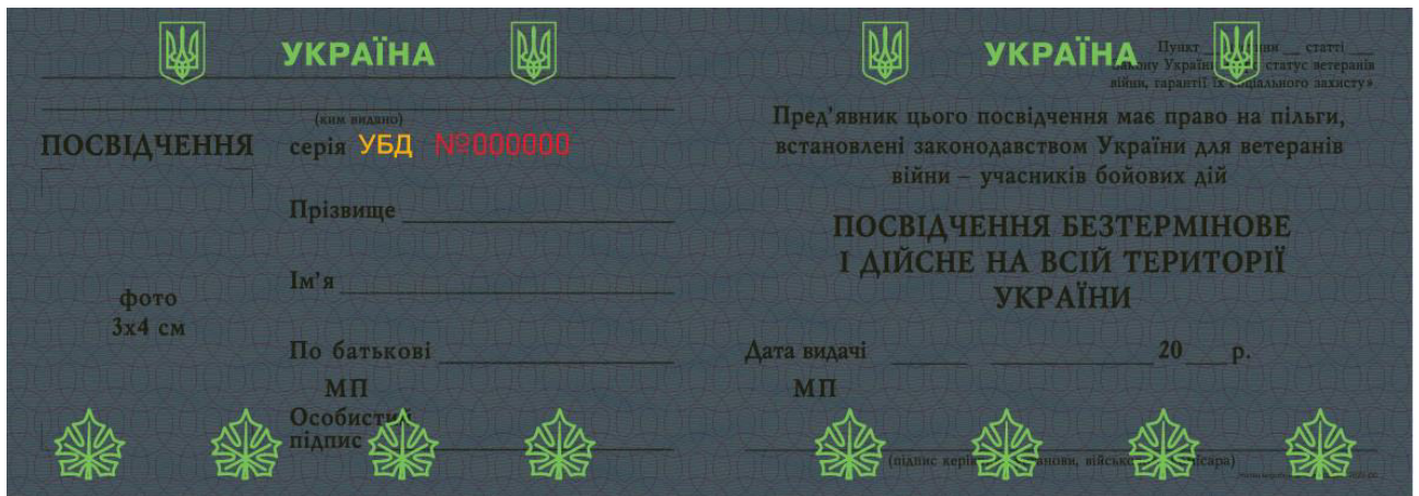
Рисунок Д2.2 – Приховані зображення