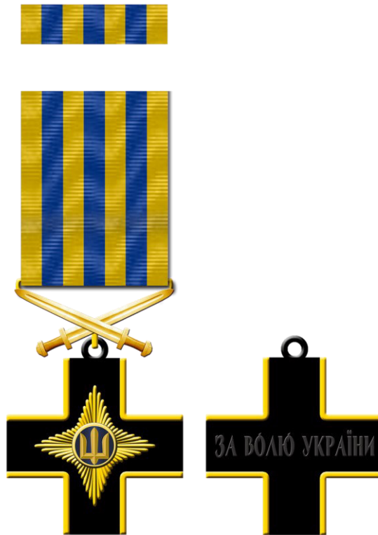
Рисунок Д1.1 – Зовнішній вигляд предмета