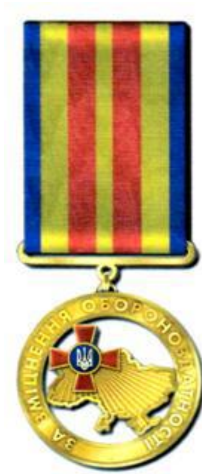
Рисунок Д1.1 – Зовнішній вигляд предмета