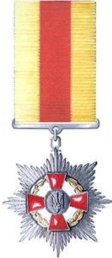
Рисунок Д1.1 – Зовнішній вигляд предмета