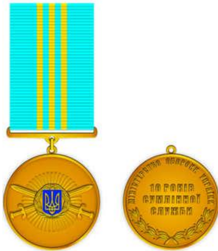
Рисунок Д1.1 – Зовнішній вигляд предмета