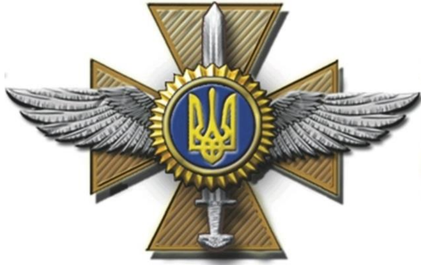
Рисунок Д3.1 – Зовнішній вигляд предмета