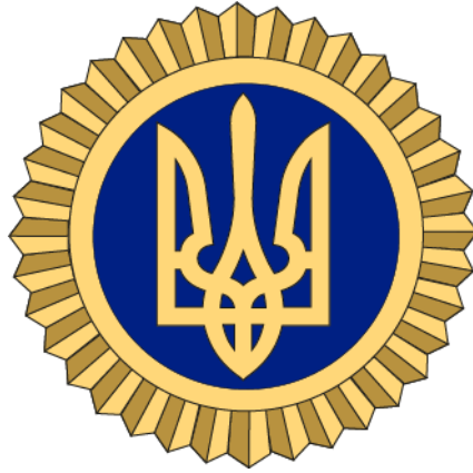
Рисунок Д3.1 – Зовнішній вигляд предмета