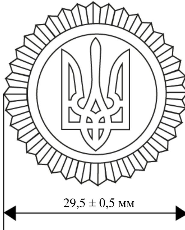
Рисунок Д1.1 – Розміри предмета