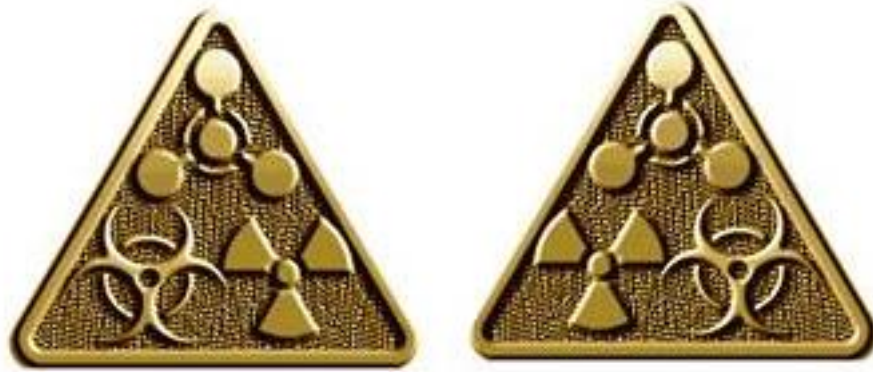
Рисунок Д3.1 – Зовнішній вигляд предмета