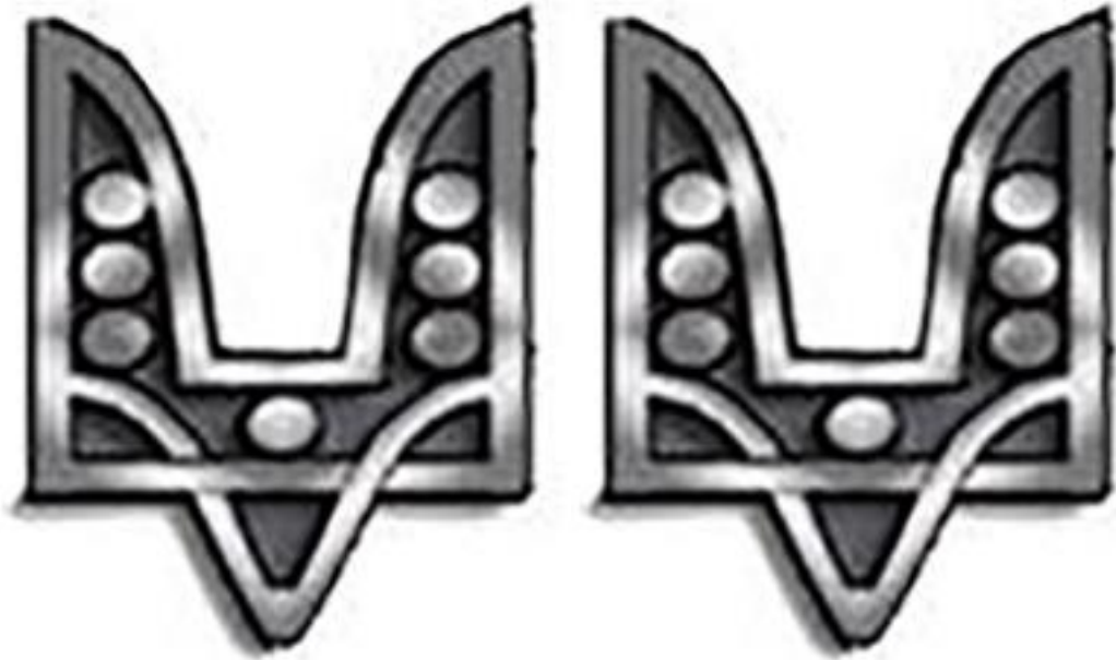
Рисунок Д3.1 – Зовнішній вигляд предмета