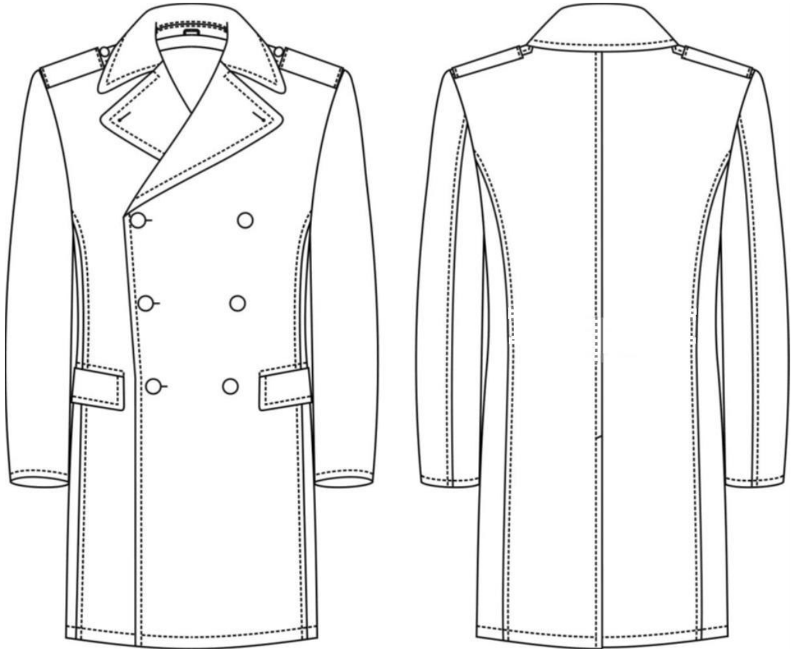
Рисунок Д1 – Зовнішній вигляд предмета