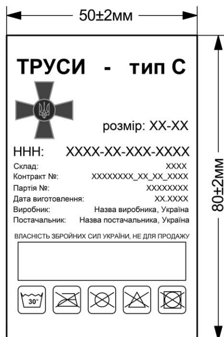
Рисунок 1 – Зовнішній вигляд товарного ярлика та його розміри у готовому вигляді

3.1.7.5. Інформація на товарному ярлику та у пакувальному листі повинна бути надрукована державною мовою.