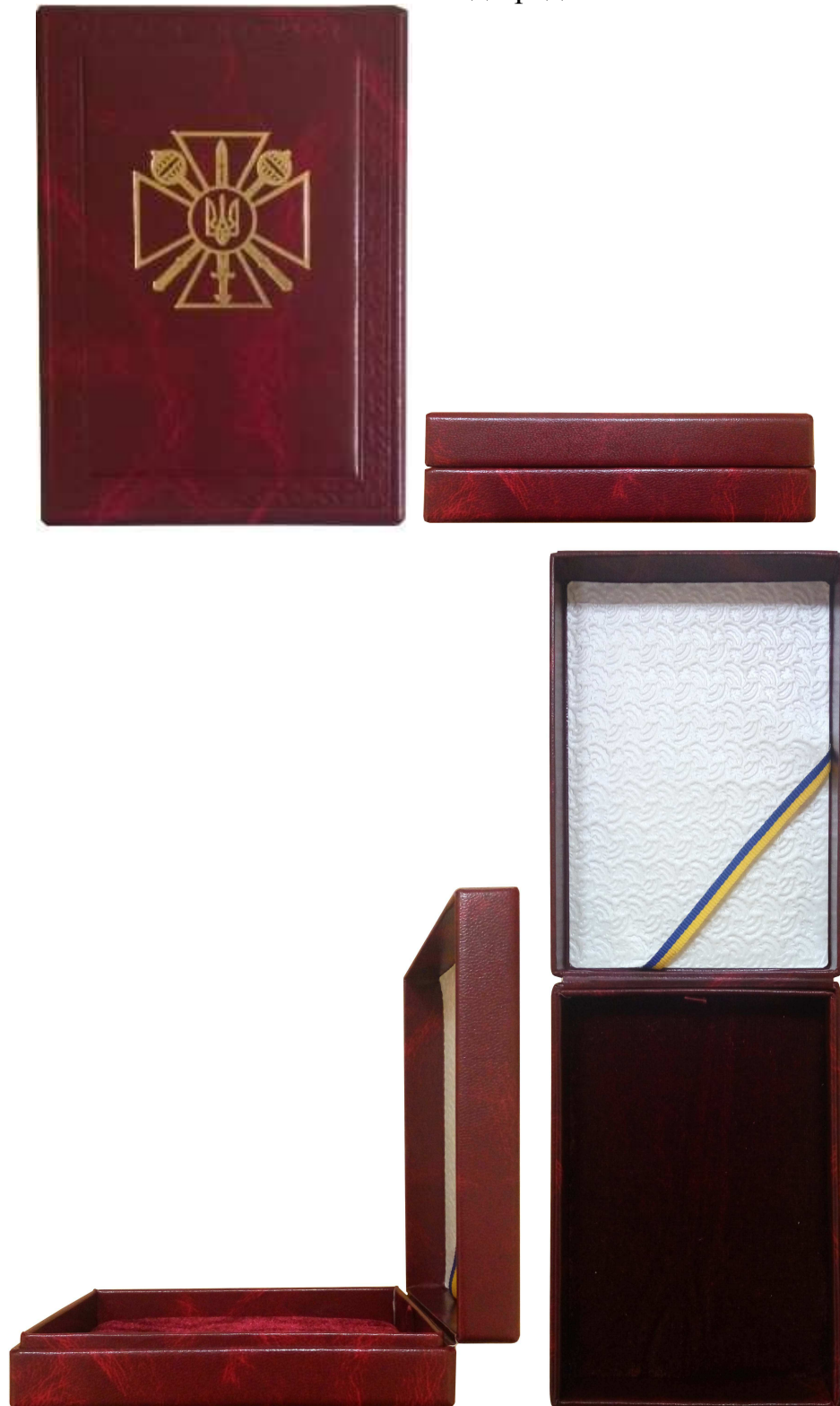
Зовнішній вигляд предмета