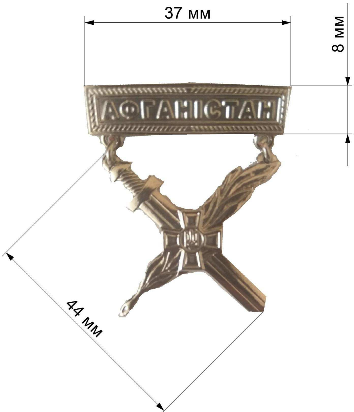
Рисунок 2 – Зовнішній вигляд та розміри нагрудних знаків.