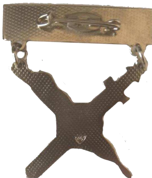
Рисунок 1 – Зовнішній вигляд нагрудних знаків.