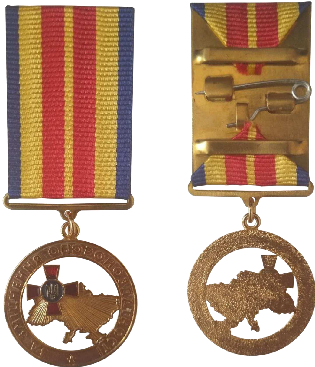
Рисунок 1 – Зовнішній вигляд медалі.