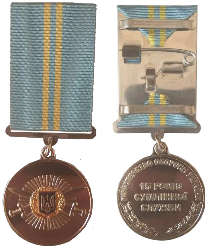
Рисунок 1 – Зовнішній вигляд медалі.