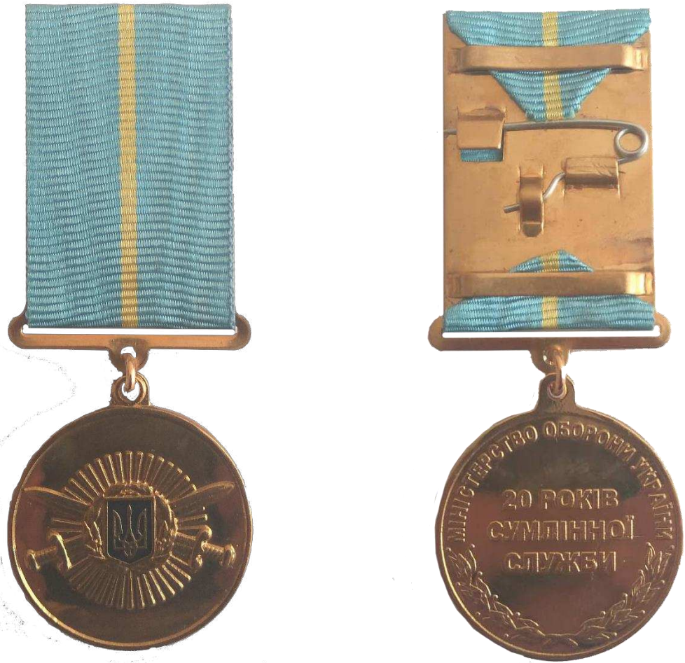
Рисунок 1 – Зовнішній вигляд медалі.