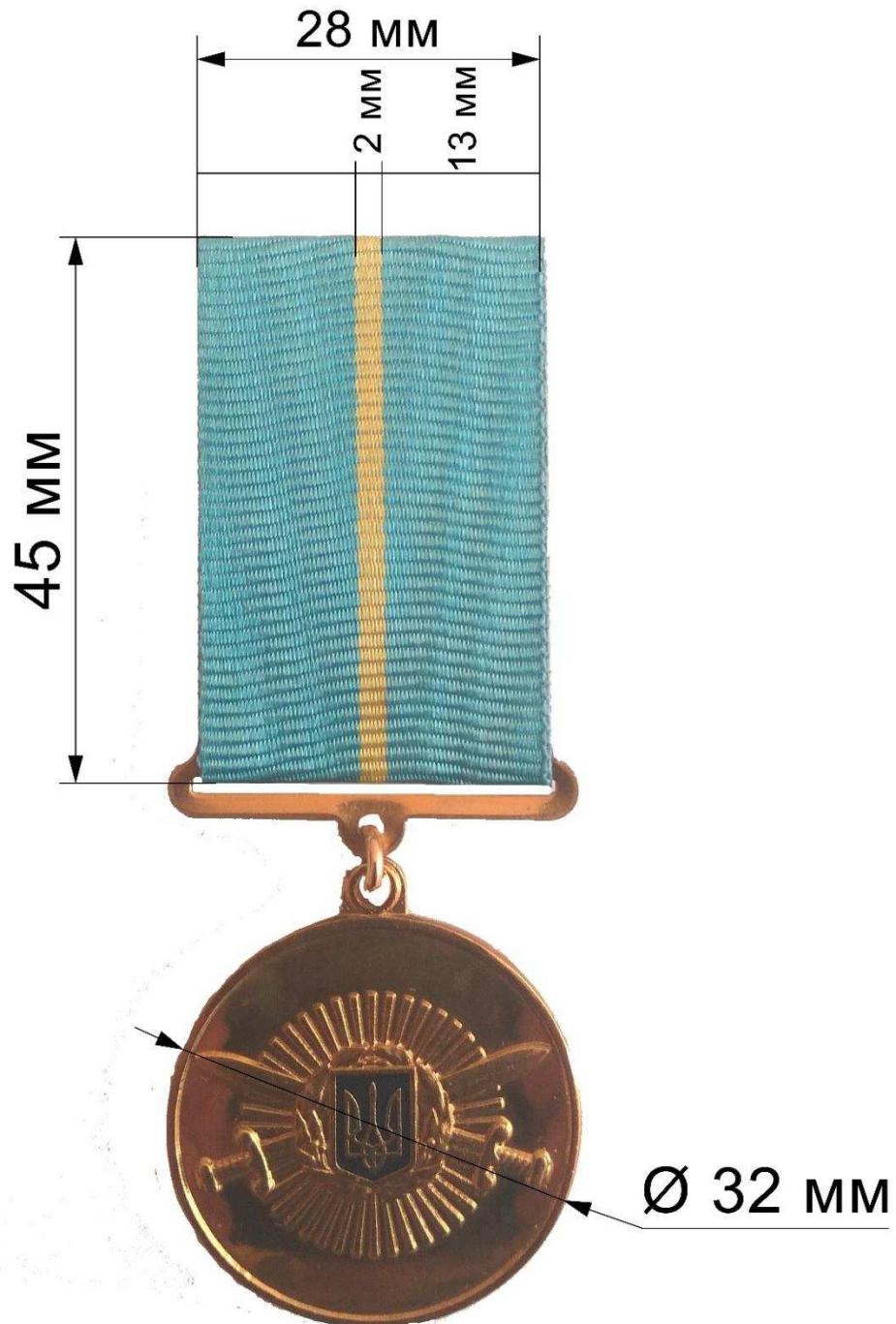
Рисунок 2 – Зовнішній вигляд та розміри медалей.