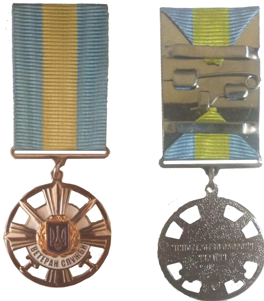
Рисунок 1 – Зовнішній вигляд медалі.