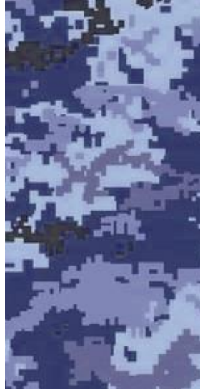
Вид 2 (ММ-16Ф)