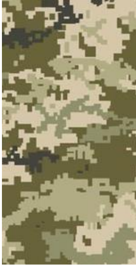
Вид 1 (ММ-14)