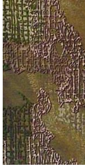
Вид 3 (Varan ЗСУ)