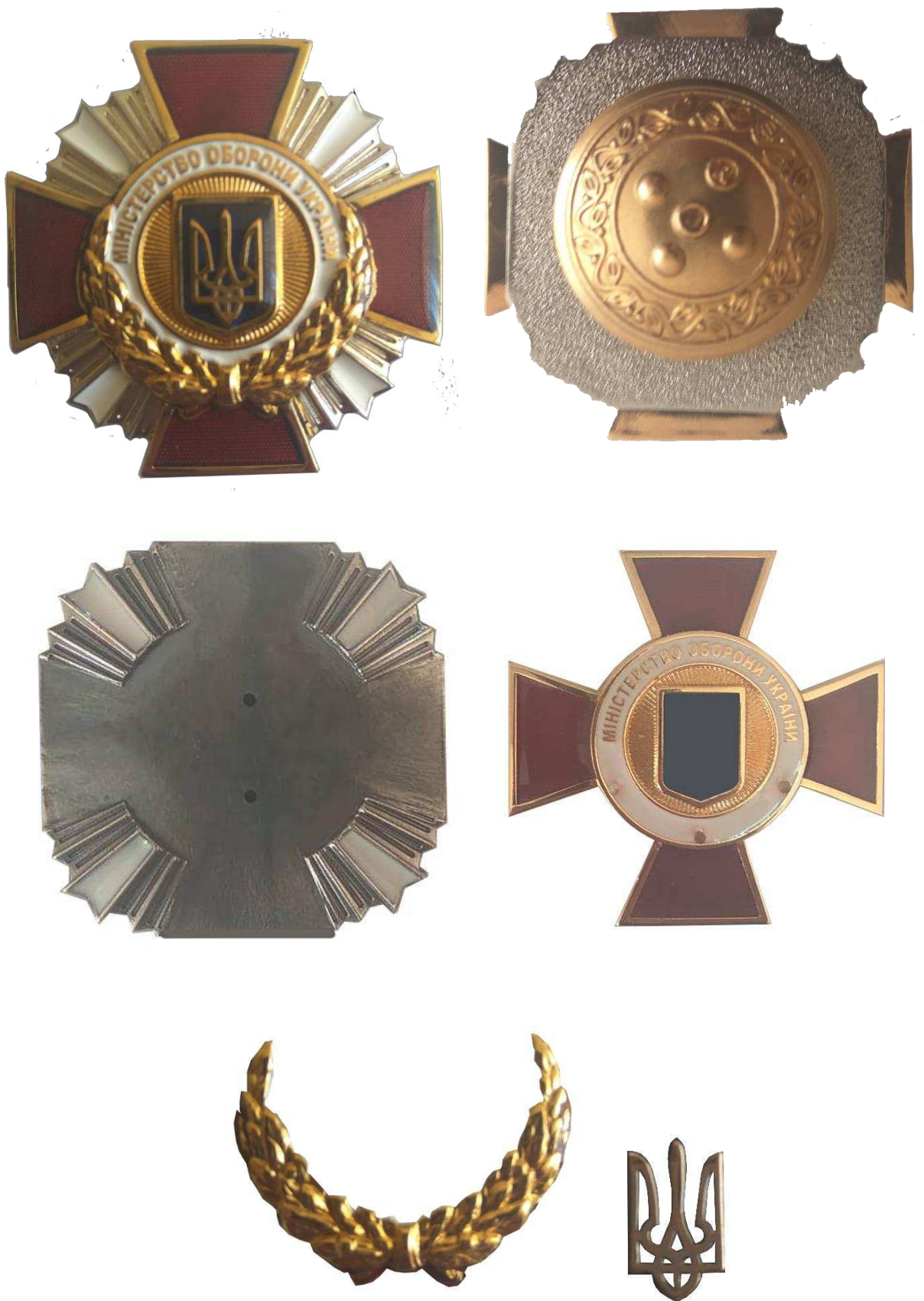
Рисунок 1 – Зовнішній вигляд нагрудних знаків.