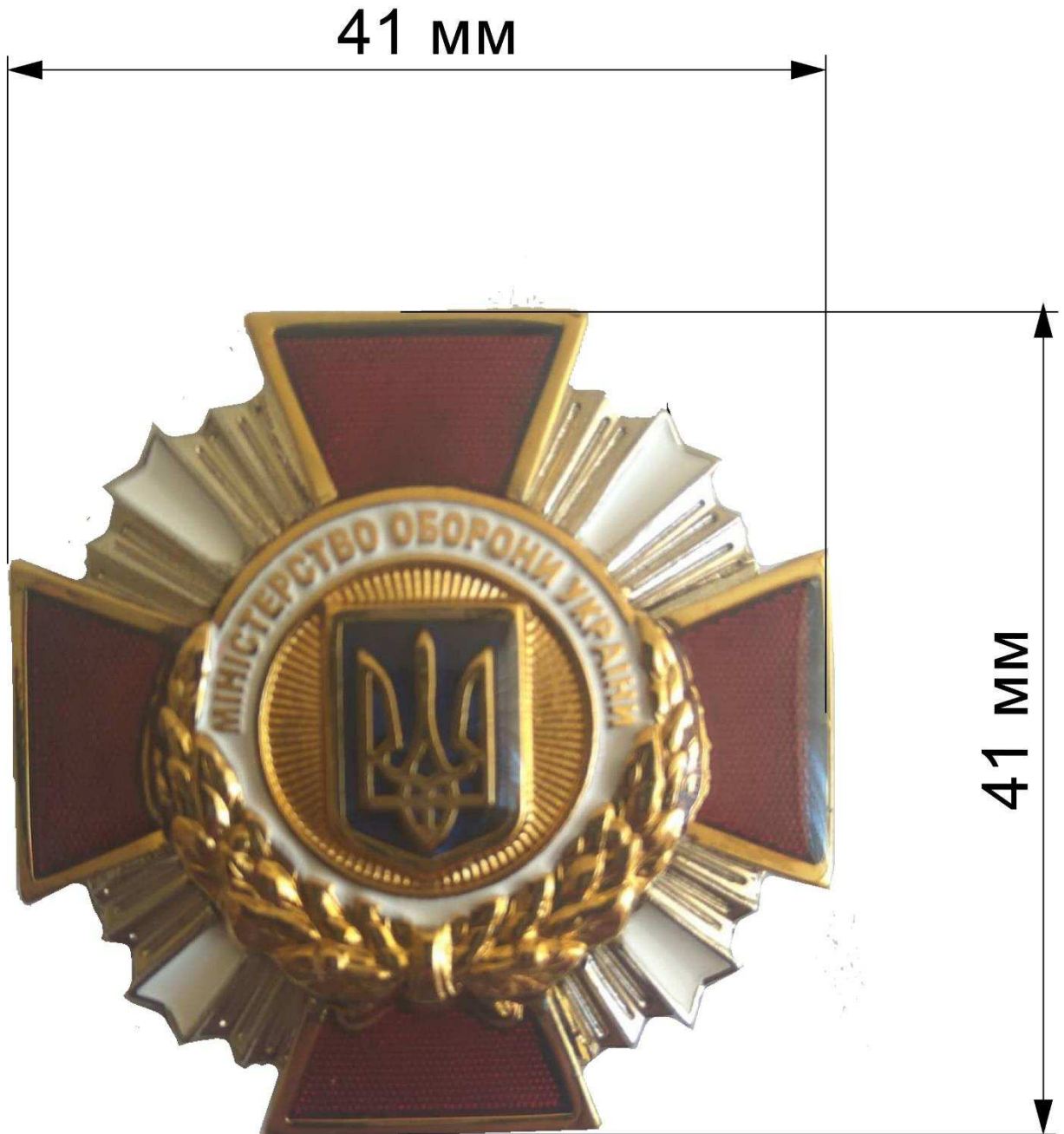
Рисунок 2 – Зовнішній вигляд та розміри нагрудних знаків.