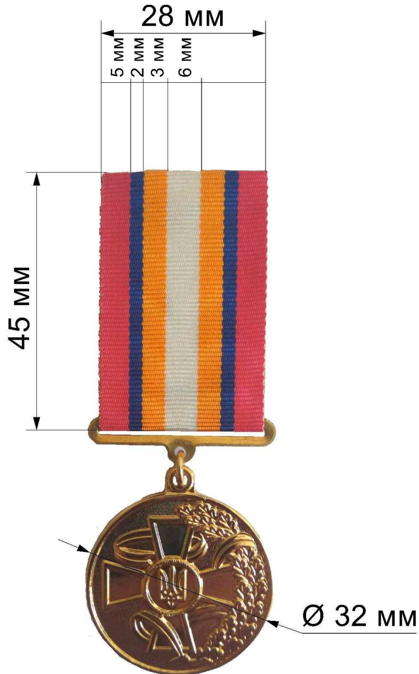
Рисунок 2 – Зовнішній вигляд та розміри нагрудних знаків.