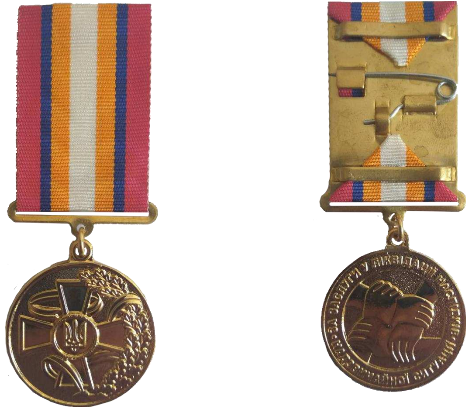
Рисунок 1 – Зовнішній вигляд нагрудного знаку.