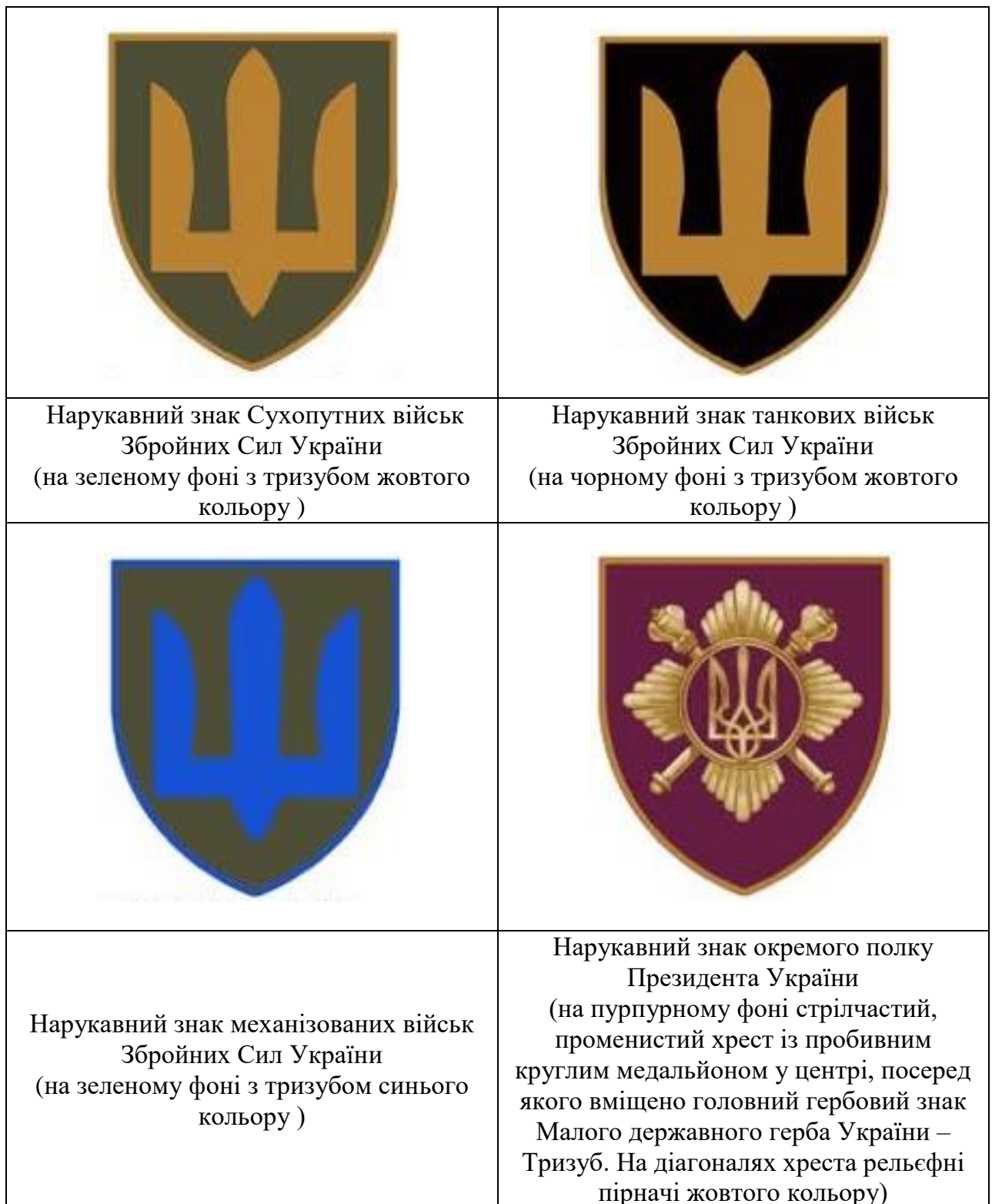
Малюнок 2. Зовнішній вигляд нарукавних знаків за видом (родом) військ