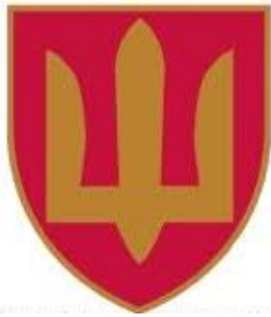
Нарукавний знак ракетних військ і артилерії Збройних Сил України (на червоному фоні з тризубом жовтого кольору)