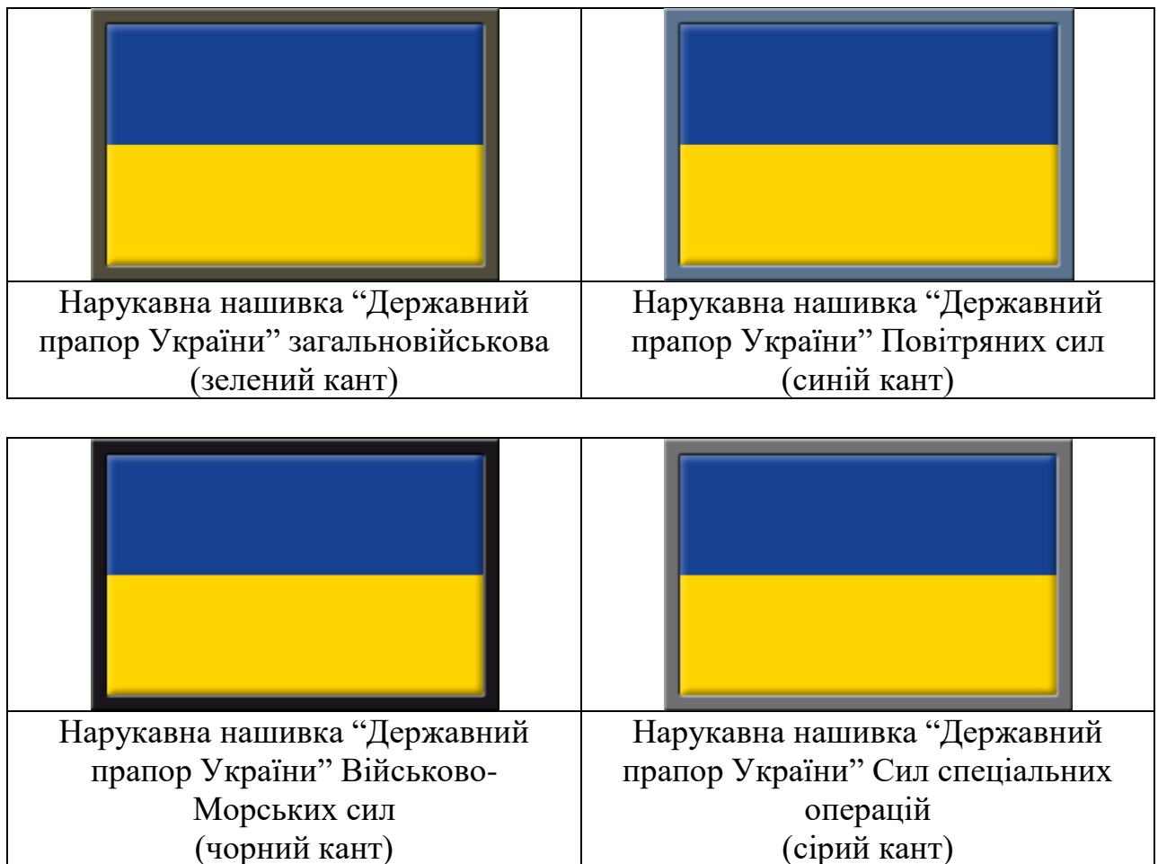
Малюнок 3. Зовнішній вигляд нарукавного знаку "Державний прапор України"

- розмір нарукавного знака використовується лише на військовій формі одягу військовослужбовців, які задіяні на параді.