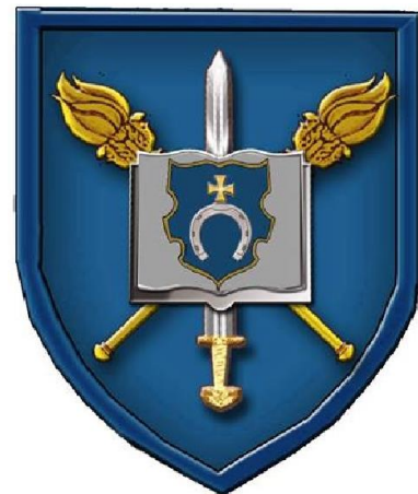
Нарукавний знак військового ліцею (на синьому фоні меч та книга сріблястого кольору, факели жовтого)