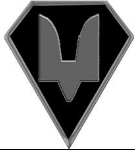
Нарукавний знак Сил спеціальних операцій (на чорному фоні двозуб сірого кольору)