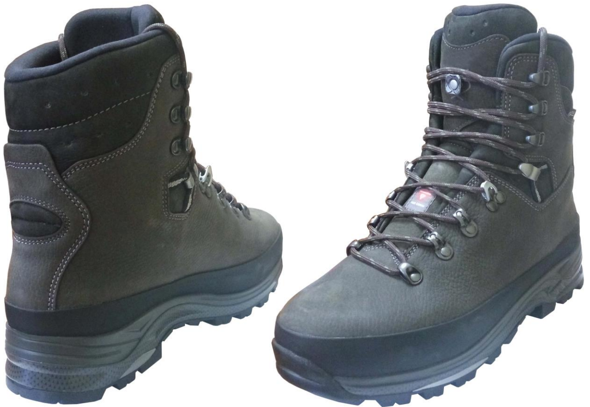
Рисунок Д1.1 – Зовнішній вигляд предмета