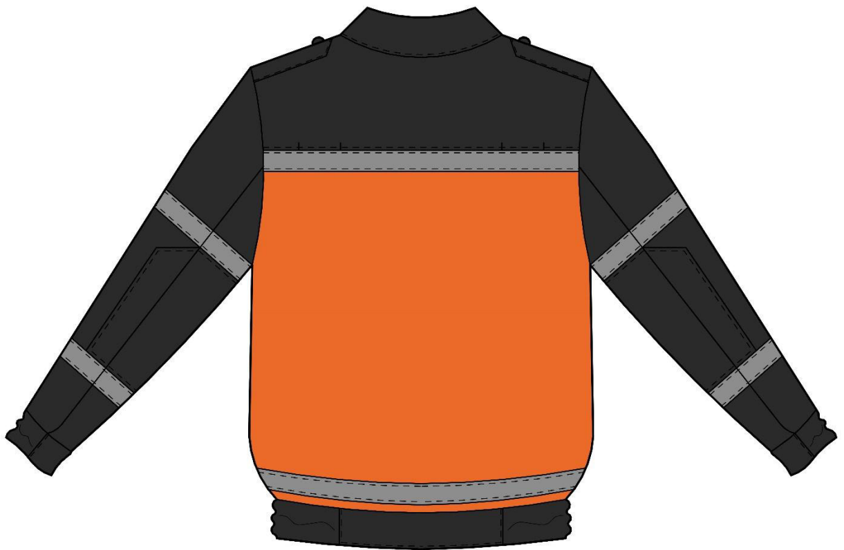
Рисунок Д 1.1 – Зовнішній вигляд предмета (куртка)