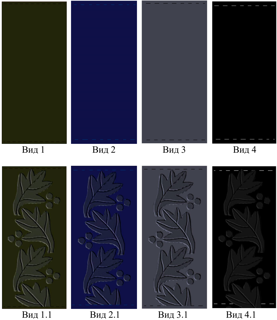
Рисунок Д2.1 – Зовнішній вигляд предмета