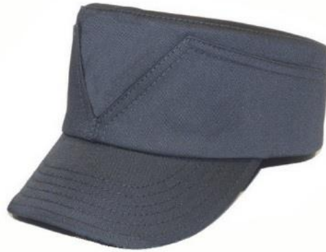
Рисунок 1 – Зовнішній вигляд кашкет для ВОХОР

строчок від переднього краю на відстані: перша (1,0 \pm 0,2) см, інші (0,5 \pm 0,1) см одна від одної. Кут нахилу козирка відносно вертикалі передньої стінки кашкета (130 \pm 5)^{\circ} .