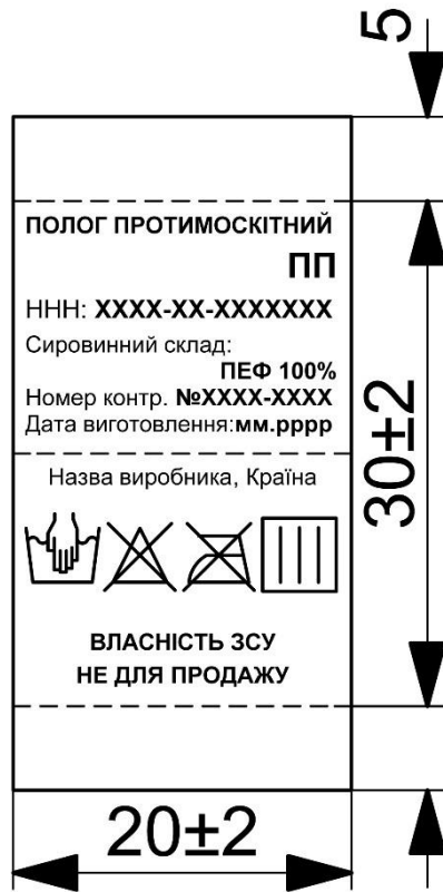
Рисунок 2 — Зовнішній вигляд етикетки виробу та її розміри